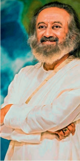
गुरुदेव श्री श्री रविशंकर

खूप कमी असतात हे खरे; पण अपवाद असतात, हे मान्य.