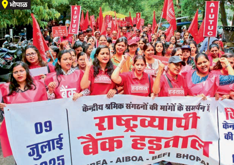
देशव्यापी संपादरम्यान भोपाळमध्ये बँक कर्मचारी मोठ्या प्रमाणात रस्त्यावर उतरले होते.

पश्चिम बंगालमध्ये कार्यकर्त्यांचा पोलिसांशी संघर्ष बंदच्या कालावधीत पश्चिम बंगालच्या विविध भागांत कार्यकर्त्यांचा पोलिसांशी संघर्ष झाला. बंद समर्थकांनी विविध रस्ते, रेल्वे वाहतूक रोखून धरली. दुकाने जबरदस्तीने बंद करण्यात आली. यावेळी अनेकांना ताब्यात घेण्यात आले. अनेक रेल्वे रोखण्यात आल्या. दरम्यान, राज्यात बंदला प्रचंड प्रतिसाद मिळाल्याचा दावा माकपाने केला.