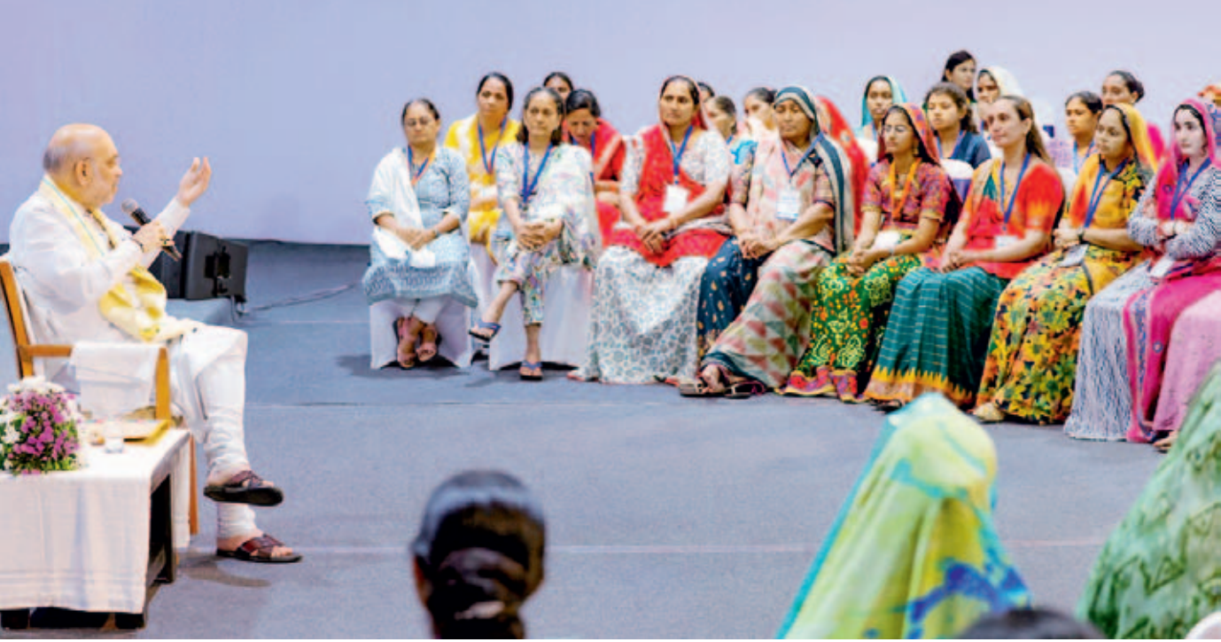
Union home minister Amit Shah during “Sahkar Samvad”, an interaction with women cooperative workers of Gujarat, Madhya Pradesh and Rajasthan, in Ahmedabad on Wednesday. Shah noted that if a person consumes food that is devoid of chemicals and fertilizers, he won’t require any medications.